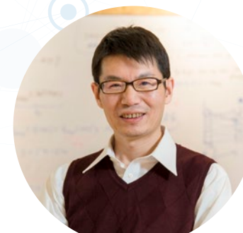
テンソル学習チーム Tensor Learning Team

When making predictions based on intelligent information processing such as machine learning, we usually have prior information about structures among variables in data. In our team, we study theories and algorithms for learning with such structural information. Moreover, we conduct applied researches by applying developed algorithms to a variety of scientific and engineering data.