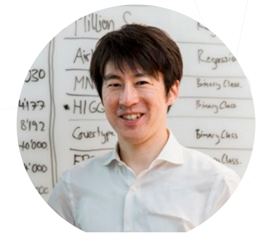
構造的学習チーム Structured Learning Team

In the Imperfect Information Learning Team, for various machine learning tasks including supervised learning, unsupervised learning, and reinforcement learning, we develop novel algorithms that allow accurate learning from limited information. We also elucidate their theoretical properties and apply them to various real-world applications ranging from fundamental science to business.