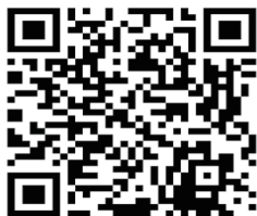
YouTube QR code

More than 100 videos including those posted the above can be linked on YouTube. You can check them from the QR code on the right.