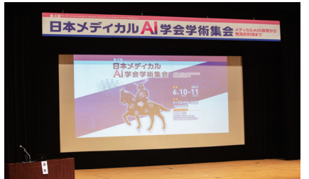
The 4th Annual Meeting of JMAI