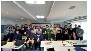
The 4th RIKEN AIP Mathematics Joint Seminar (February 22nd-24th)