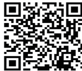
YouTube QR code