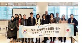
認知行動支援技術チームセミナー Cognitive Behavioral Assistive Technology Team Seminar

[In the media] "How to interact with AI technologies" (Mainichi Shinbun morning edition, June 14, 2023)