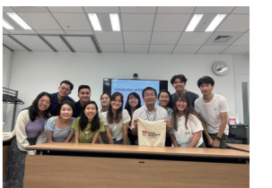
Nanyang Technological University Students Visit on June 16, 2023