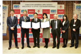
共同研究研究契約式 scene of the ceremony

▶ Search "Kishiwada City Nobana Health Promote AIP"