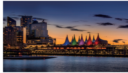
Vancouver Convention Center, Canada