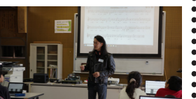
AI作曲体験(桑名市立多度中学校) School Song Project